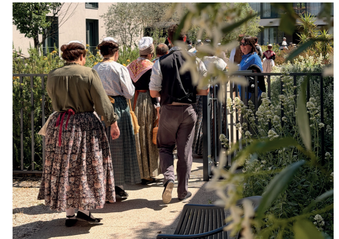
Les groupes folkloriques se sont succédés pour offrir un moment de partage à l'EHPAD intercommunal.