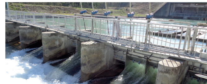
Réseau d'eau unique de Mallemort, de plus de 60 km

Le Canal de Carpentras reste ainsi un acteur central de l'irrigation et de l'adaptation au changement climatique.