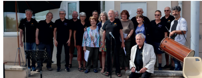
La chourmo de Parlaren jounquiero Le groupe de Parlaren jounquiero

Quau tèn sa lengo, tèn la clau Qui maîtrise sa langue, tient la clé Frederi Mistral