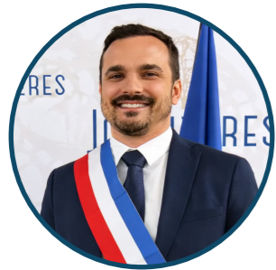
SÉBASTIEN ORIVELLE Maire, Vice-Président de la Communauté de communes du Pays d'Orange en Provence