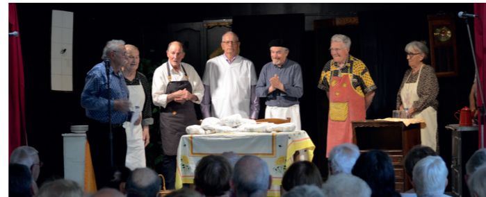
Quàquis un dis atour d'uno pèço de tiatre tirado d'un conte de Edmond Marrel ; li gigot Quelques uns des acteurs d'une pièce de théâtre tirée d'un conte de Edmond Marrel : les gigots.