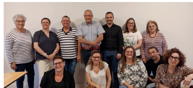
Les nouveaux membres du Conseil d'Administration du CCAS

À cette occasion, les membres du Conseil ont procédé à l'examen et à l'adoption du budget du CCAS. Les orientations budgétaires adoptées permettront notamment de soutenir les actions en matière d'aide sociale, d'accompagnement des personnes âgées, de lutte contre l'isolement, ainsi que les dispositifs d'inclusion et de solidarité.