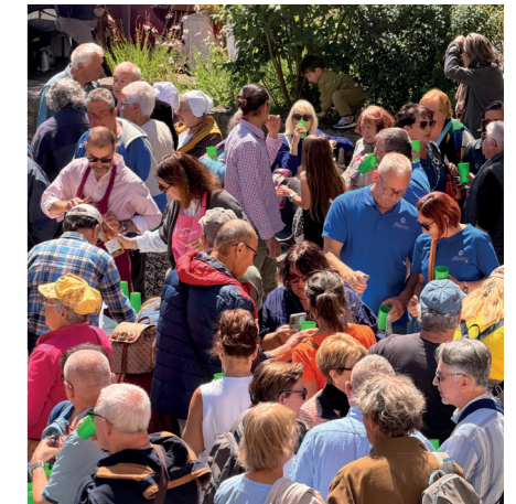
Un moment convivial, apprécié par les visiteurs, lors de l'apéritif offert par les vigneronnais jonquiérois et la Municipalité