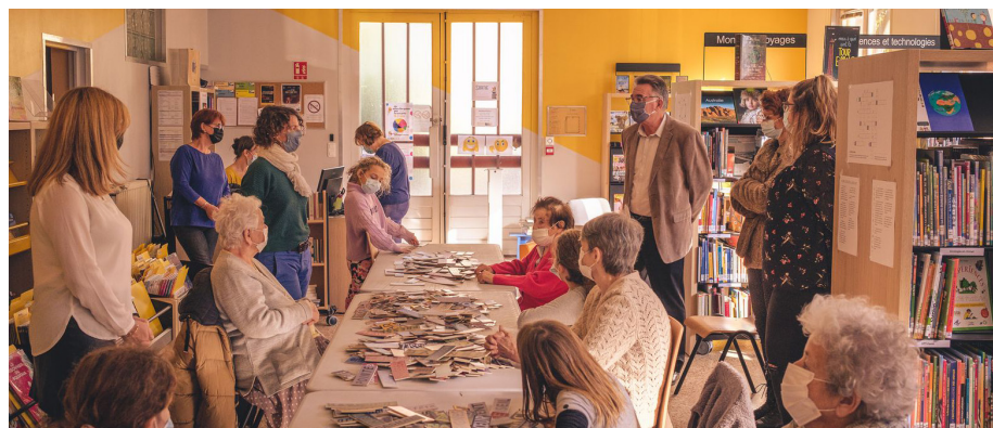
Le dernier atelier intergénérationnel s'est déroulé à la bibliothèque municipale.