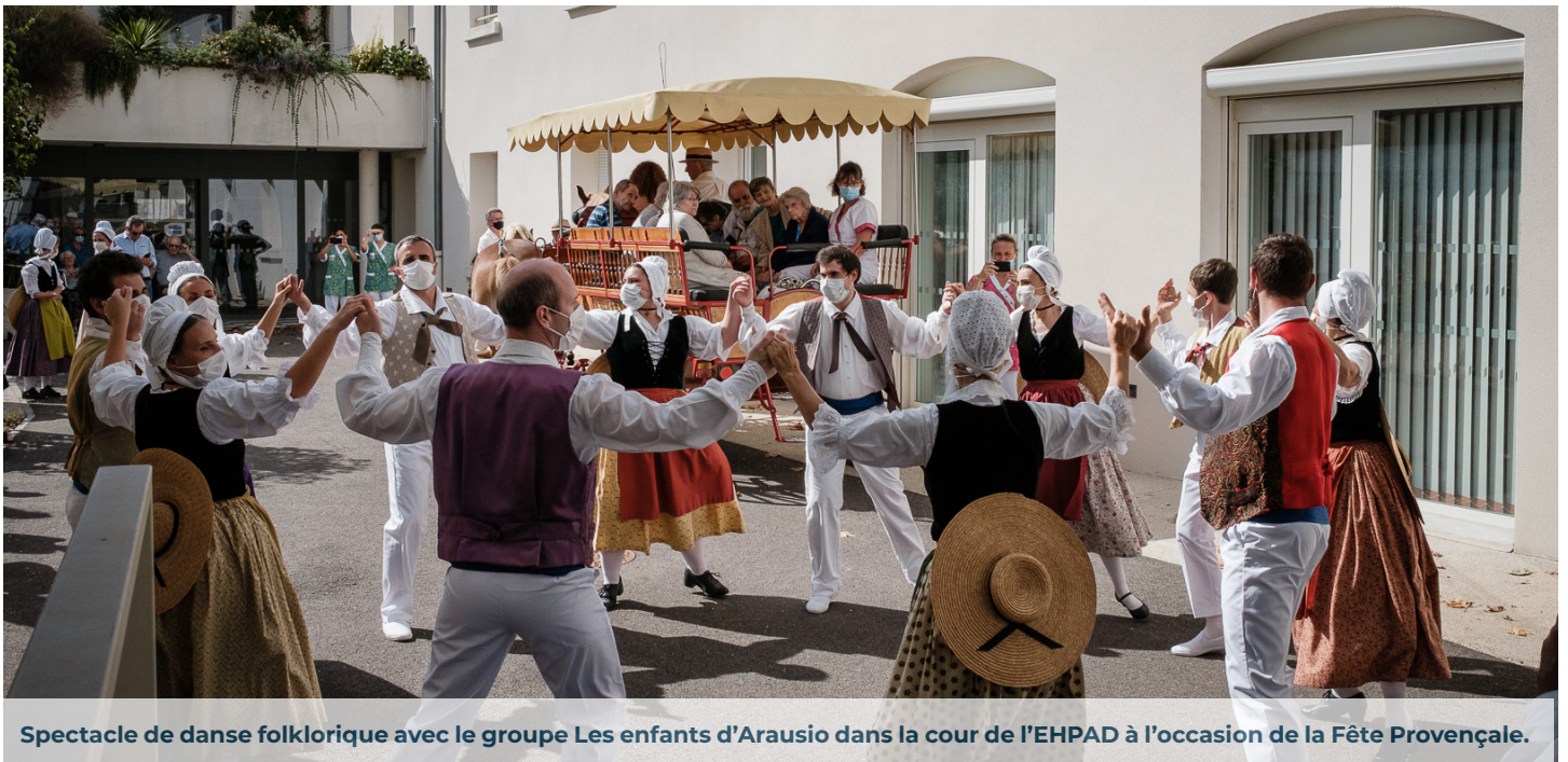
Spectacle de danse folklorique avec le groupe Les enfants d'Arausio dans la cour de l'EHPAD à l'occasion de la Fête Provençale.