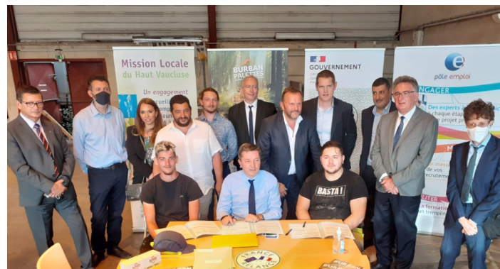
Le préfet de Vaucluse, Bertrand Gaume, était en visite mardi 28 septembre chez Burban Palettes, à Jonquières. Entreprise qui a bénéficié des mesures d'aide à l'emploi du plan de relance, pour l'embauche de deux jeunes.

Pour cette 22 ème agence ouverte par la société, une dizaine de personnes ont été recrutées, avec pour objectif une vingtaine de salariés courant 2022. Pour l'entreprise dont le service ressources humaines avait contacté la mairie, ce travail de recrutement de proximité permet de renforcer les liens et d'apprendre à connaître les élus locaux.