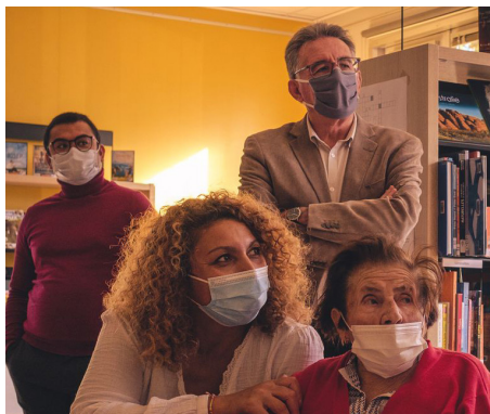
L'animatrice et une résidente de l'EHPAD et Monsieur le Maire.

Cette résidence entre dans le cadre du dispositif "Rouvrir le Monde" de la Direction Régionale des Affaires Culturelles, dans le cadre de l'été culturel 2021 du Ministère de la Culture. La DRAC PACA invite des artistes de la région à rouvrir le monde à nouveau avec les enfants, les jeunes, les familles et tous les habitants. Le